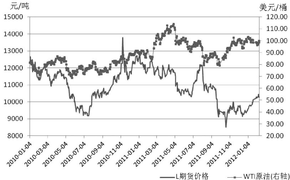
图3 石脑油日本CFR价格、连塑期货价格

当然，如果伊朗问题导致霍尔木兹海峡被封锁，甚至引发战争，国际原油价格必然暴涨，连塑也将获得较强的上涨动力。届时，连塑价格与经济面、供需面的背离将为投资者逢高位做空提供良好的历史机遇。图2 WTI原油价格及连塑期货价格