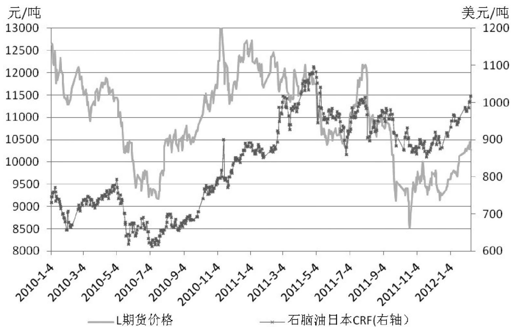
图 4 连塑折算成本，石化报价及期价对比